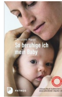
Patmos So beruhige ich mein Baby

Ansonsten möglichst wenige Strategiewechsel. Oft schafft man das allein nicht, dann muss man sich Hilfe holen.